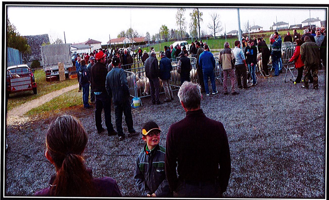
Foire aux agneaux 2019