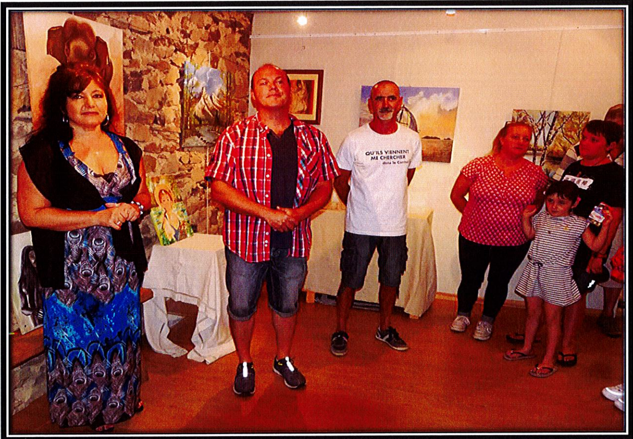
Exposition Chantal LACIPIERE été 2019