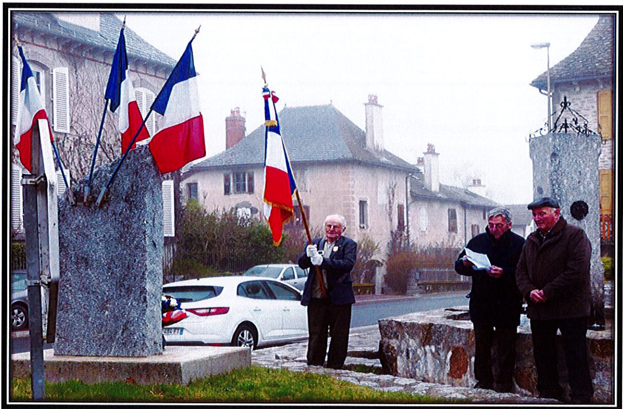
Cérémonie du 19 mars 2019