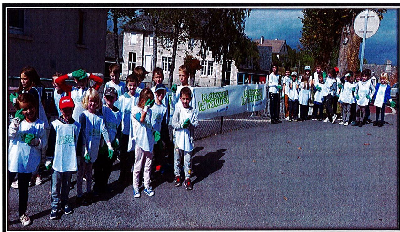
Opération nettoyons la nature septembre 2019