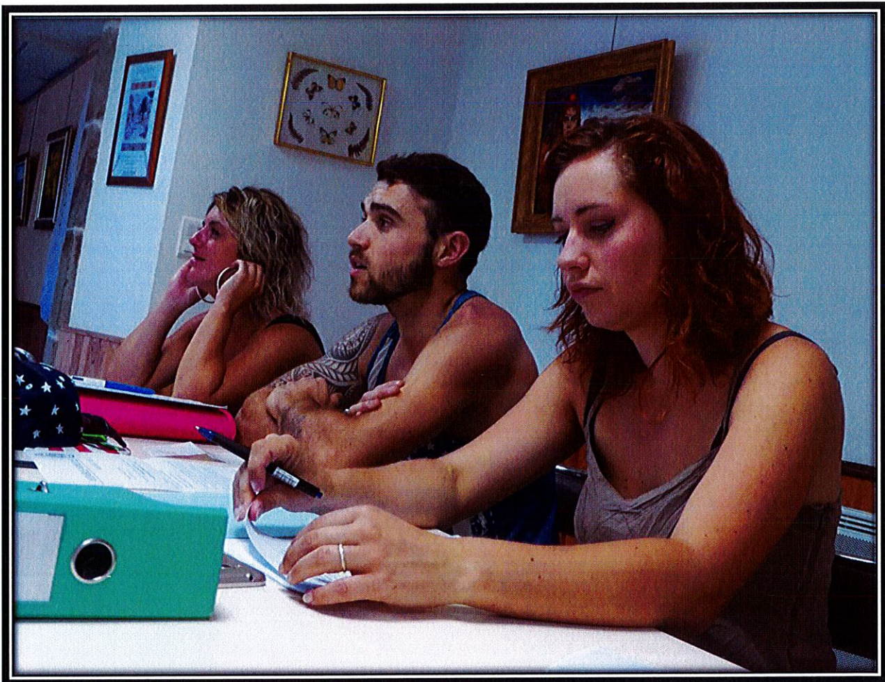
Assemblée générale 2009