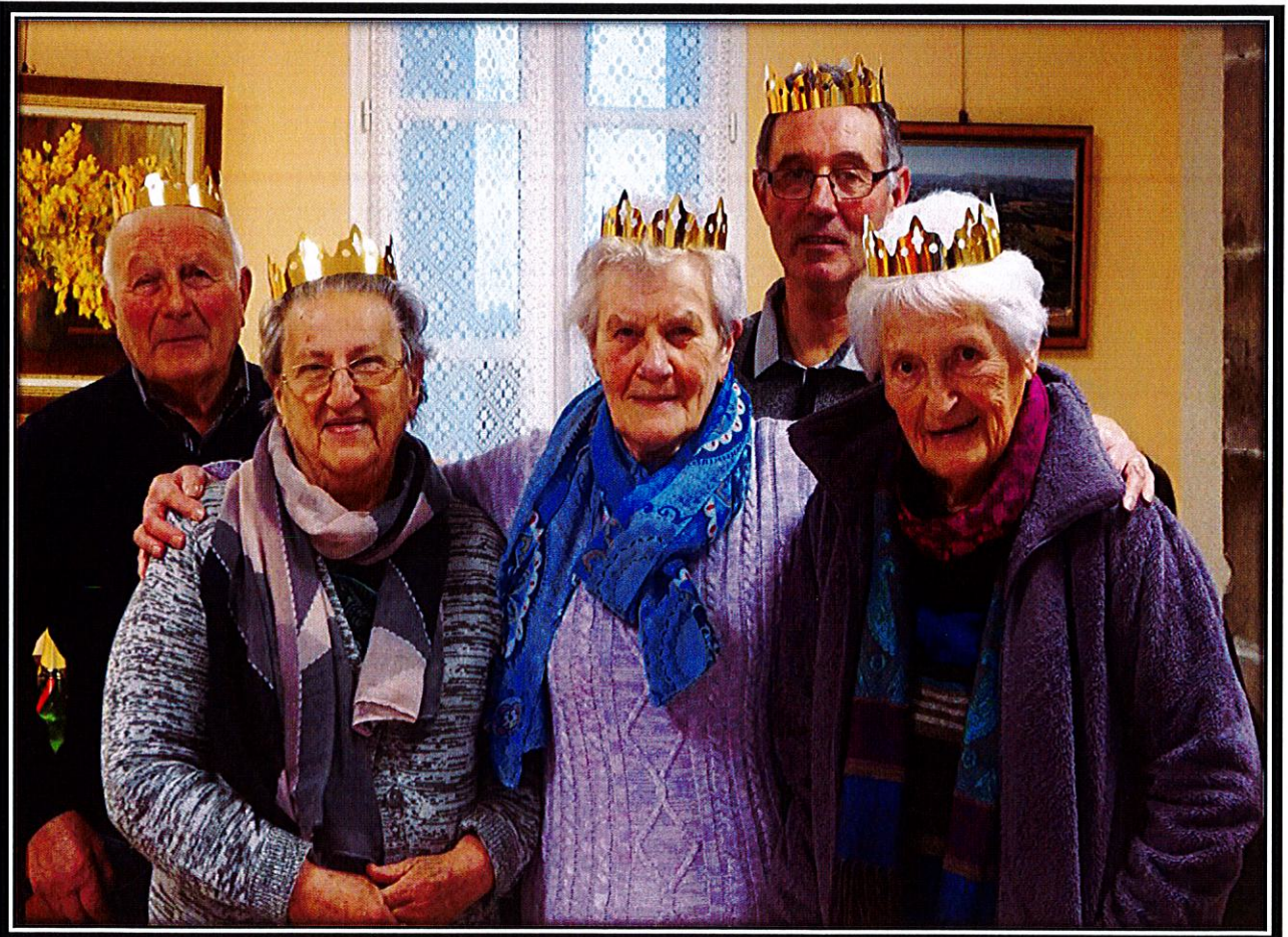
Galette des rois 2020