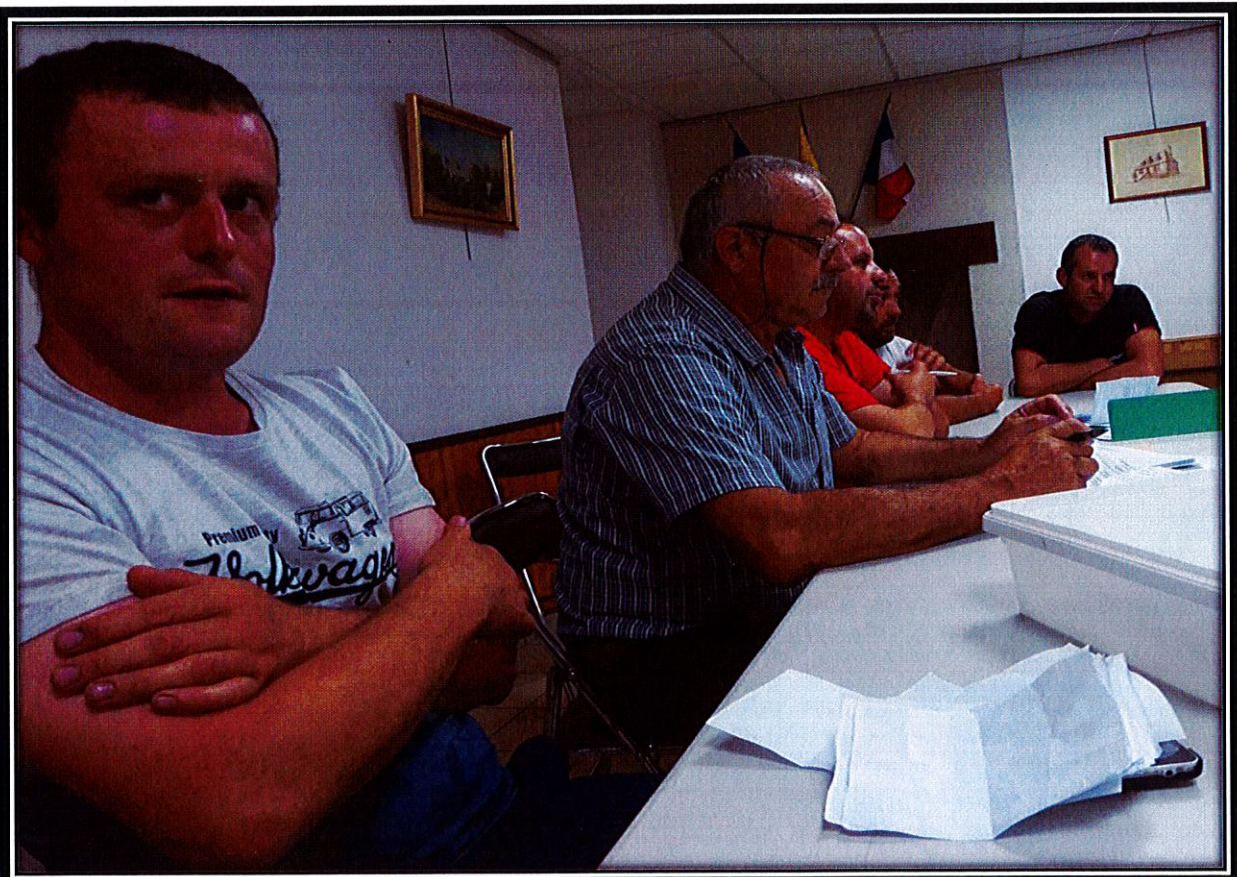
Assemblée générale 2019