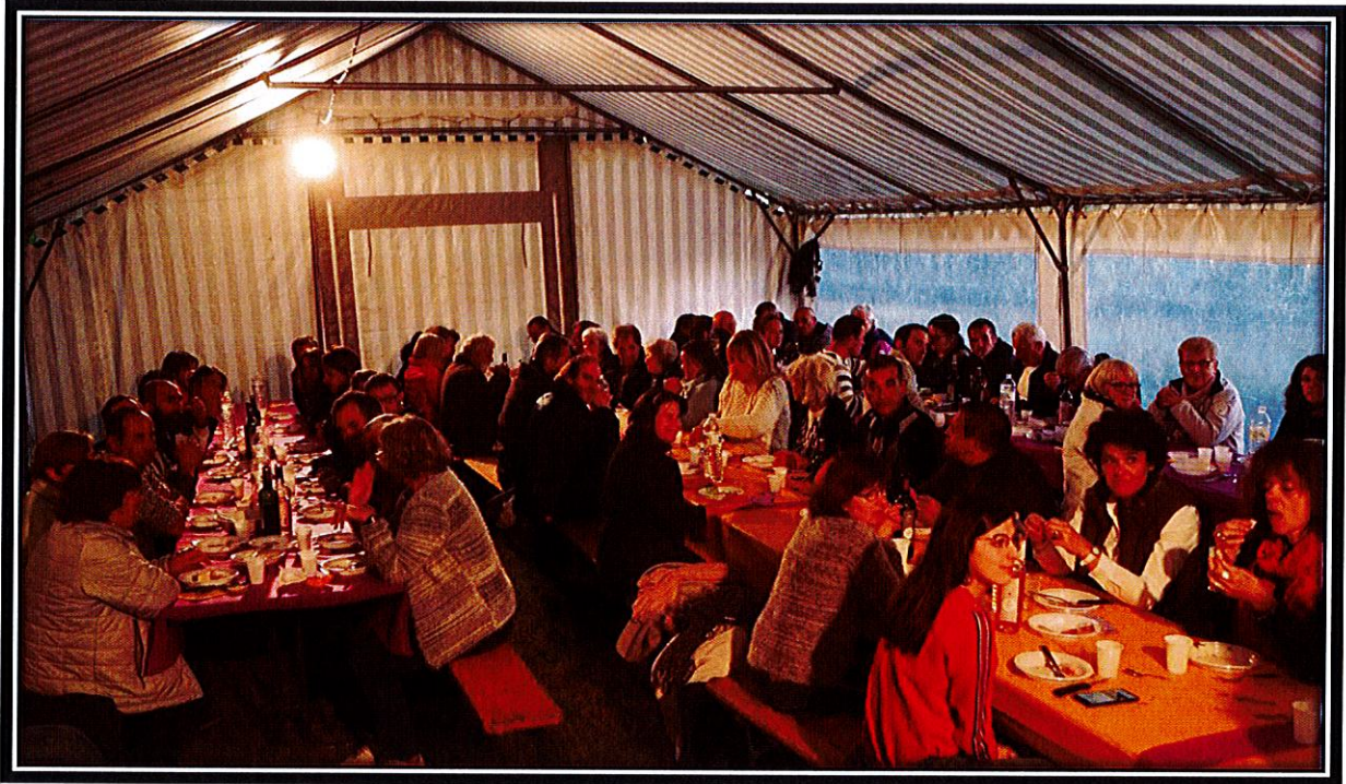
Repas de la Fête 2019