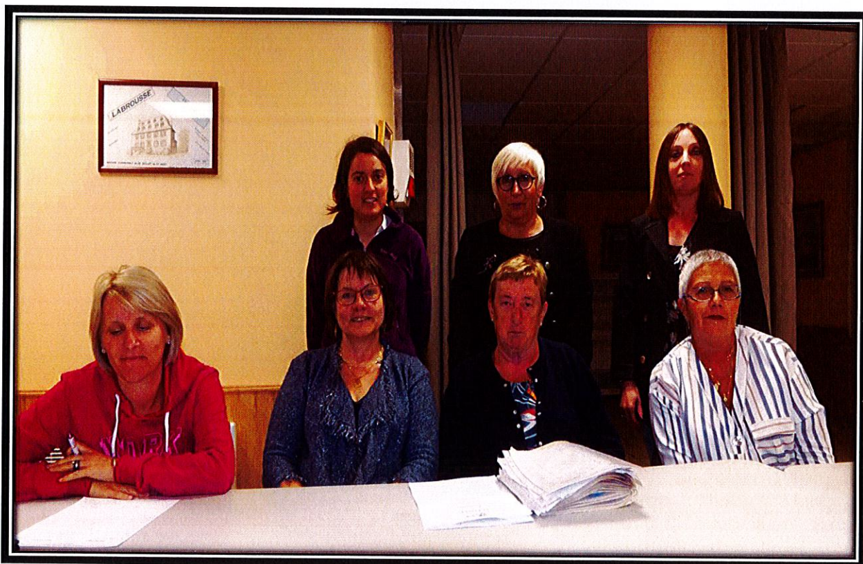
Assemblée générale 2019