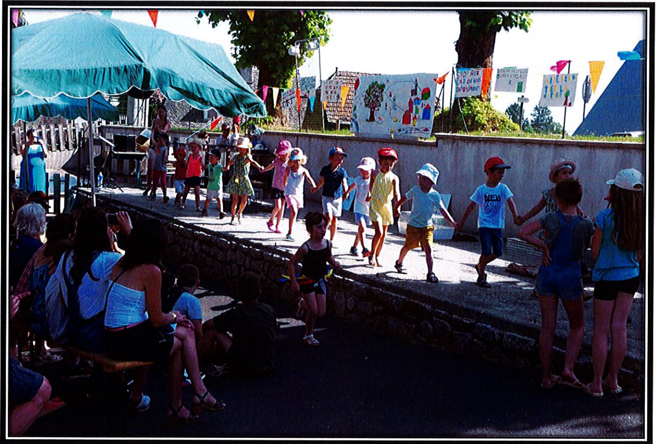
Fête de l'école 2019