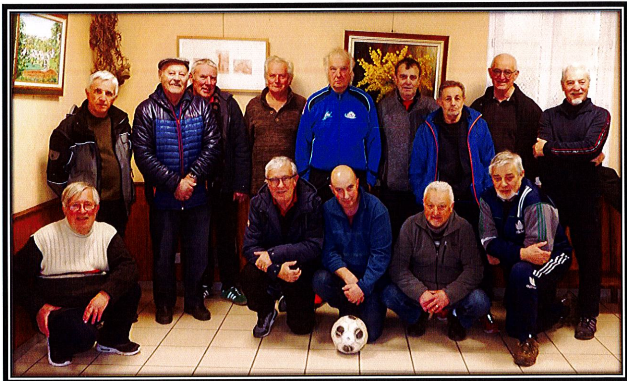
Rencontre de janvier 2020