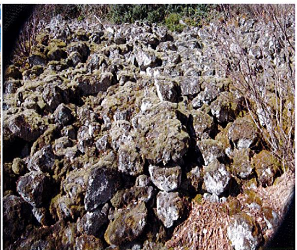
Eboulis ROCHE de MOISSAC