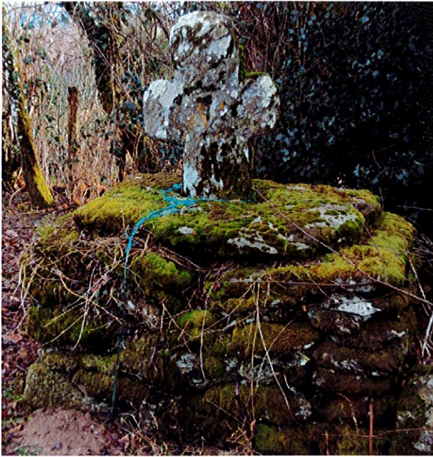
La croix de LASVEISSIERES