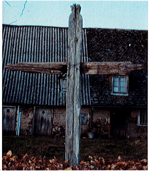
La croix de LA FAGE